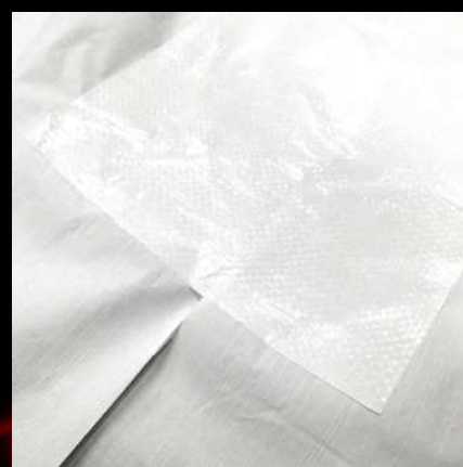
養生シートのつなぎに