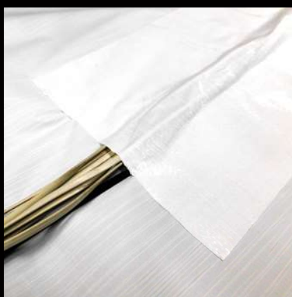
仮設コードの養生に